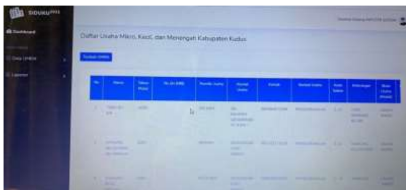
Gambar: Data UMKM Kudus yang sudah terinput

Sistem Informasi Data UMKM Kudus yang selanjutnya disebut SIDUKU, tentunya dibuat sebagai salah satu penunjang dalam pendataan UMKM yang kemudian lebih lanjut akan dikembangkan sebagai dasar pembentukan sistem marketplace UMKM. SIDUKU yang terbentuk pada tahun 2021 tentunya masih mengalami perbaikan demi tercapainya 100% pendataan UMKM yang ada di Kabupaten Kudus. Aplikasi yang dirasa memudahkan masyarakat untuk mendapatkan wadah pengenalan hingga pendistribusian produk mereka tentunya harus didukung penuh oleh semua pihak, terlebih dalam situasi pandemi yang pernah mengobrak ngabrik sektor perdagangan hingga banyak pengusaha yang gulung tikar.