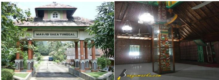
Gambar 1. Masjid Saka Tunggal Banyumas

Nilai yang terkandung dalam matematika tersebut bahwa jika kita membuat 0 (nol) pikiran kita (berpasrah diri pada Allah SWT) maka justru akan mendapatkan sesuatu yang sempurna. Sebagaimana digambarkan dari bangunan Masjid Saka Tunggal bahwa orang yang senantiasa berpasrah diri pada Allah SWT (senantiasa datang ke rumah Allah SWT) akan mendapatkan 1 (satu) pondasi dasar yang kuat dalam hidup.