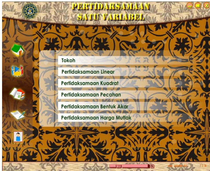
Gambar 4 Menu Materi

Menu materi adalah bagian yang menampilkan tombol-tombol pilihan materi yang terdiri dari materi pertidaksamaan linear, pertidaksamaan kuadrat, pertidaksamaan pecahan, pertidaksamaan bentuk akar dan pertidaksamaan harga mutlak. Ketika pengguna memilih materi yang diinginkan maka akan muncul isi materi yang dipilih tadi. Tampilan materi dapat dilihat pada Gambar 3: