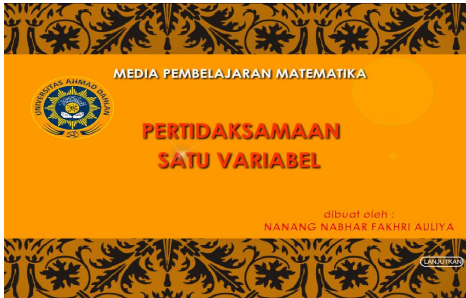
Gambar 1 Bagian Pembukadan Judul