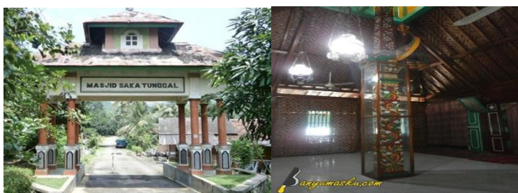
Gambar 1. Masjid Saka Tunggal Banyumas

Nilai yang terkandung dalam matematika tersebut bahwa jika kita membuat 0 (nol) pikiran kita (berpasrah diri pada Allah SWT) maka justru akan mendapatkan sesuatu yang sempurna. Sebagaimana digambarkan dari bangunan Masjid Saka Tunggal bahwa orang yang senantiasa berpasrah diri pada Allah SWT (senantiasa datang ke rumah Allah SWT) akan mendapatkan 1 (satu) pondasi dasar yang kuat dalam hidup.