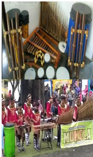
Gambar 2. Alat Musik dan Grup Kentongan Banyumas

Mengajarkan matematika melalui eksplorasi matematika yang terkandung dalam kearifan lokal budaya. Pembelajaran matematika yang dalam mengajarkannya dilakukan dengan mengeksplorasi budaya lokal daerah dikenal dengan pembelajaran berbasis budaya lokal dan lebih umum disebut dengan etnomatematika. Misalkan dalam mengajarkan volume tabung bisa mengeksplorasi dari hasil budaya lokal Banyumas yaitu Kentongan dengan mengeksplorasi alat-alat musik yang dimainkan dalam Kentongan Banyumas.