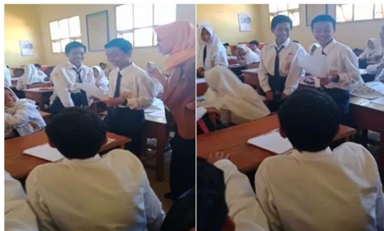
Gambar 2. Kelompok 1 Menyampaikan Salam dan Memberikan Soal Kepada Kelompok 3

Setelah semua kelompok menyelesaikan tugas pertama, peneliti memandu proses berkirim salam dan soal. Kegiatan ini dilakukan dengan saling menukarkan soal, yaitu kelompok 1 bertukar soal dengan 3, kelompok 2 bertukar soal dengan kelompok 4, kelompok 5 bertukar soal dengan kelompok 7, dan kelompok 6 bertukar soal dengan kelompok 8. Sebelum memberikan soal kepada kelompok lain, perwakilan kelompok menyampaikan salam (Gambar 2).