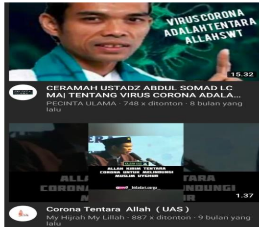
Gambar 5. Ustadz Abdul Somad sebut Virus Corona adala Tentara Allah

Pernyataan UAS dapat dikatakan benar, karena merujuk tafsir Muhammad Abduh (Ilham, 2020). Imam Masjid Baitul Musholih mengatakan banyak jemaah di masjidnya yang menyepakati pernyataan UAS bahwa COVID-19 adalah tentara Allah yang diutus untuk menyerang musuh-musuh Islam (Ucok, 2020). UAS adalah ulama yang memiliki ilmu mendalam, banyak menguasai hadis, sehingga sangat tidak mungkin UAS membohongi umat dengan menggunakan dalil-dalil. Jika yang mengatakan adalah orang biasa, maka pernyataan COVID-19 sebagai tentara Allah patut dipertanyakan (Basihin, 2020). Seorang Tim Muda UAS Jambi mengatakan bahwa COVID-19 hanya permainan pemerintah, akal-akalan untuk menggunakan dana yang besar. Faktanya, banyak aktifitas seperti yasinan, dan acara pernikahan tidak berdampak pada peningkatan angka positif COVID-19. Sehingga pembatasan beribadah di luar rumah memunculkan pertanyaan di masyarakat (Ridwan, 2020). Para penceramah yang konten ceramahnya cenderung anti sains dan berafiliasi ke Persaudaraan Alumni 212 sangat berpengaruh dalam membentuk persepsi dan radikalisasi perilaku beragama di masa Pandemi COVID-19.