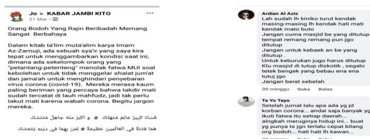
Gambar 1. Perbincangan Teologis Pandemi COVID-19 dan

Grup Facebook Kabar Jambi Kito terjadi perdebatan pro dan kontra yang bersifat teologis dalam menyikapi Pandemi COVID-19. Terdapat postingan yang menyampaikan Kitab Ta'lim Muta'alim karya Imam Az-Zarnuji yang kemudian diserang dengan komentar kontra: Bahwa pemerintah hanya menutup masjid namun tidak bisa menutup diskotik; Tidak terdapat Muslim yang mengikuti shalat Jum'at terkena COVID-19; Pandemi COVID-19 merupakan pertanda akhir zaman; Cina sebagai sumber konflik sudah melakukan ibadah shalat.