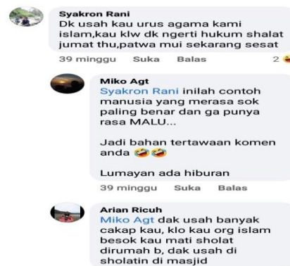
Gambar 2. Otoritas Ulama di Masa Pandemi COVID-19

Dibandingkan dengan data lapangan, masyarakat menyatakan nyawa dan takdir berada di tangan Allah bukan oleh virus, hingga membuat tetap banyak pengurus masjid menyelenggarakan tarawih berjamaah. Muncul sikap ekstrim tanpa pengetahuan dengan landasan ilmiah, “kenapa kami harus takut mati” (Nawi, 2020). Himbauan MUI agar pelaksanaan ibadah dilakukan di rumah dan menutup sementara masjid untuk menghindari interaksi fisik ketika menjalankan ritual ibadah umat Islam yang seharusnya tidak perlu dikhawatirkan secara berlebihan. Masjid bagaimanapun keadaannya harus diramaikan, dimakmurkan dan dipenuhi dalam rangka mendekatkan diri kepada Allah. Umat Islam menyadari bahwa Pandemi COVID-19 adalah teguran dan peringatan kepada manusia agar tetap melaksanakan ibadah dan kehadiran COVID-19 tidak mesti menjadikan masjid sepi (Suhar, 2020). Terdapat masyarakat menyatakan MUI setan, karena telah melarang umat Islam beribadah di rumah ibadah selama masa awal Pandemi COVID-19 (Ilham, 2020).