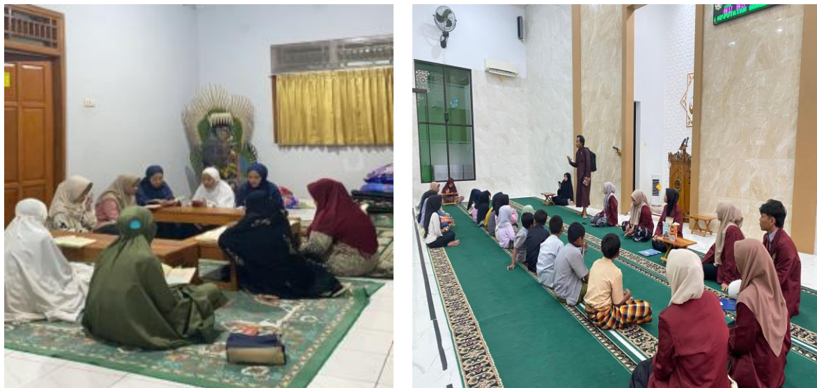
Gambar 1. TPQ Baitul Muttaqin Dan Rumah Qur'an Al Muttaqin binaan Masjid Raya Al-Falah Sragen

merangkul seluruh lapisan masyarakat, sehingga nilai-nilai Islam dapat diinternalisasi secara lebih mendalam dan aplikatif dalam kehidupan sehari-hari.