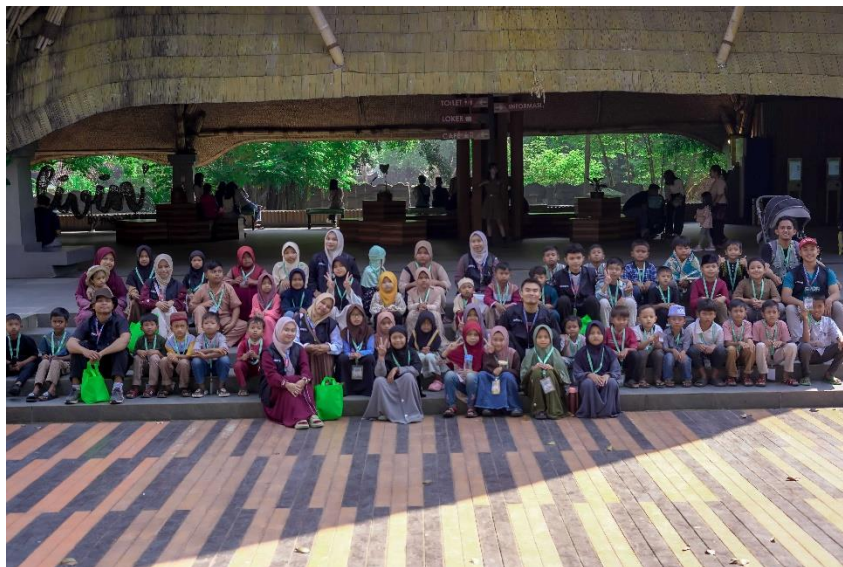
Gambar 6. Yatim Fun Day di Safari Solo

Selain terlibat di Al-Falah Market, mahasiswa juga mendukung kegiatan sosial-ekonomi lainnya, seperti membantu dokumentasi produk Hydromart, mendampingi pengurus dalam menyiapkan kebutuhan logistik, serta ikut mempublikasikan kegiatan masjid melalui media sosial agar lebih dikenal oleh masyarakat luas. Partisipasi ini membuat mahasiswa belajar bahwa ekonomi masjid tidak sekadar transaksi jual-beli, melainkan juga sarana memperkuat ukhuwah dan kemandirian umat.