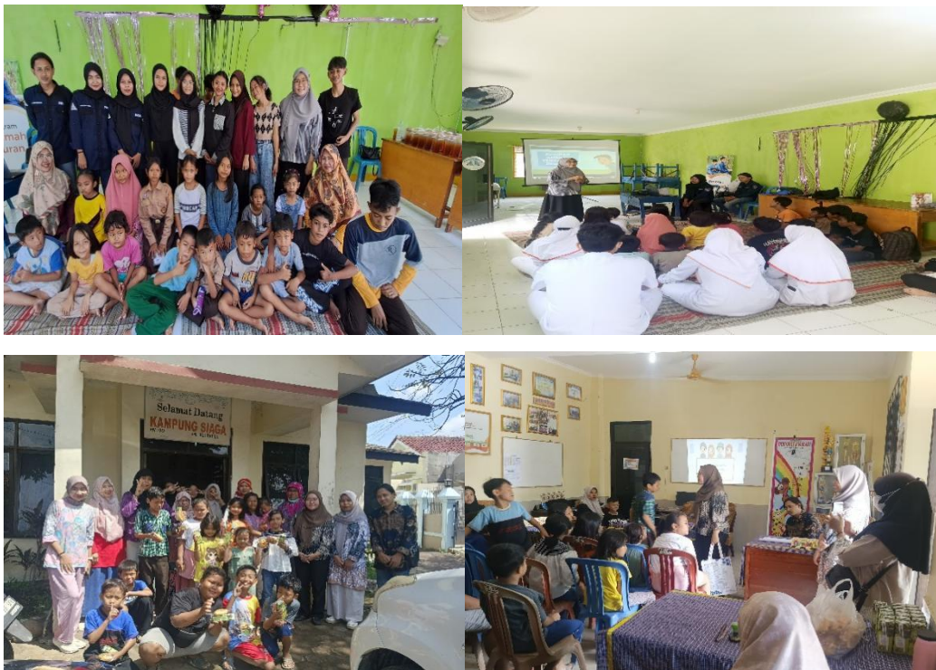
Gambar 1.1 Kegiatan Penyampaian Pencegahan HIV/AIDS Pada Remaja